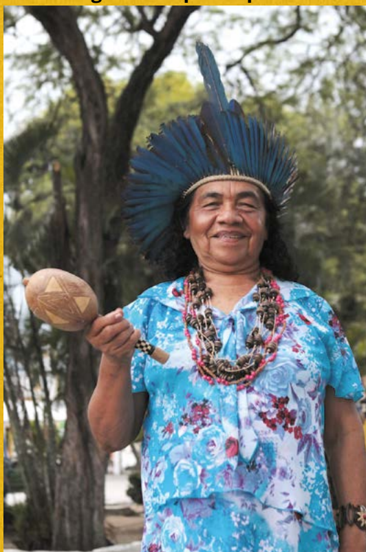
Fig.7. Cacique Pequena