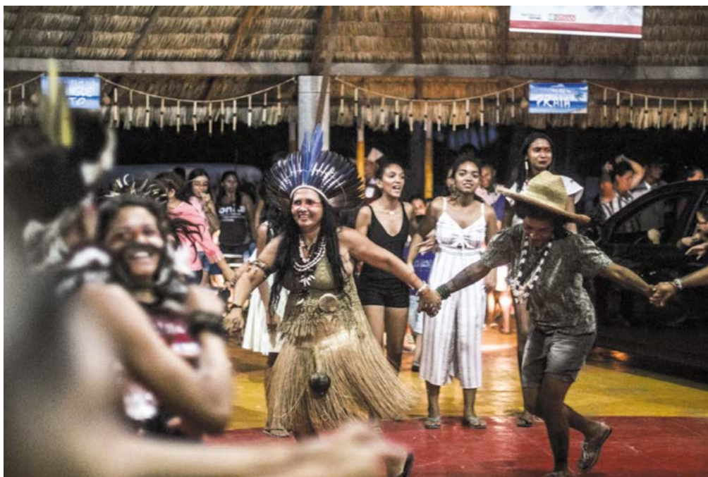
Fig.2. Torém com os parentes

São mais de 26 mil índios espalhados em suas aldeias nas cidades cearenses, seja na serra, sertão, litoral ou área metropolitana. Dançar o Torém deve servir para dizer “ eles estão lá, eles estão aqui e estas são suas demandas, sua força e sua alegria em resistir ”. O Torém foi e é mais que dança. Ele é sinal de resistência em ritual cantado, memória social coletiva e fator de agregação dos parentes. Ele é lúdico, espiritual e político. Quando o conheci na década de 80/90 do séc. XX, ele circulava e era sabido na aldeia do povo Tremembé de Almofala (Itarema). Hoje, vejo como sua roda foi se infiltrando como um rizoma nos diversos municípios, trazendo de volta quem precisou se esconder para sobreviver diante da perseguição indígena, durante o famigerado processo “civilizatório”. Assim, essa dança ritual de legado ancestral dos Tremembé de Almofala, pode ser vista sendo realizada pela população indígena composta também pelo povo Anacé, Gavião, Jenipapo-Kanindé, Kalabaça, Kanindé, Kariri, Pitaguary, Potiguara, Tapeba, Tabajara, Tapuia-Kariri, Tremembé, Tubiba-Tapuia e Tupinambá.