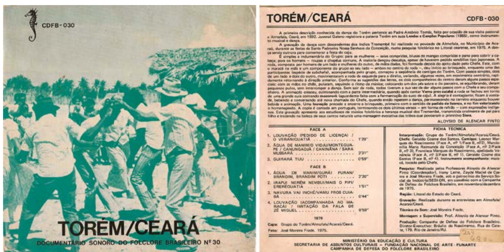
Fig. 9. Documento Sonoro do Folclore Brasileiro nº 30